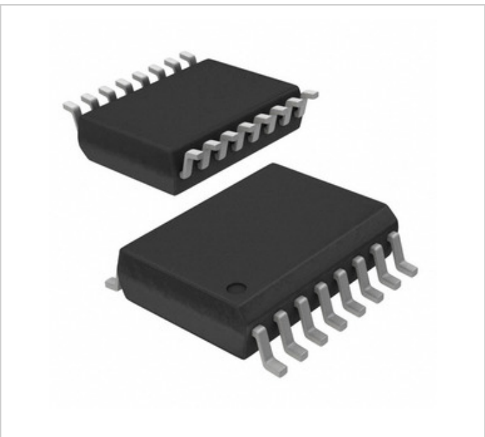
Obraz může být reprezentován. Viz specifikace podrobností o produktu.